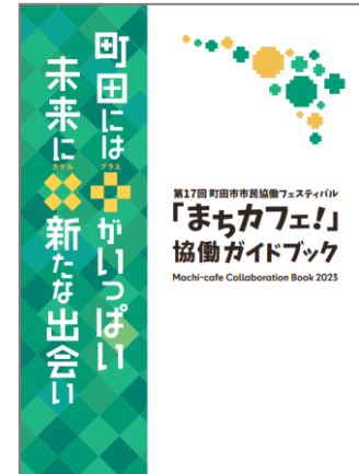
まちカフェ！協働ガイドブック

まちカフェ！協働ガイドブックについて教えてください。 [第2章特集ページ (4～34ページ)]